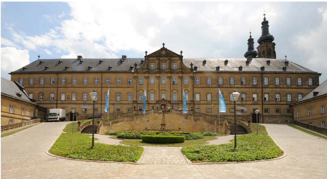
Innenhof Kloster Banz

Die Unterbringung der Tagungsgäste erfolgt in 79 Einzel- und 44 Doppelzimmern . Das Haus verfügt auch über 6 Dreibettzimmer, 1 Vierbettzimmer und 2 behindertengerechte Doppelzimmer . Unsere Zimmer sind im „Klosterstil“ ausgestattet.