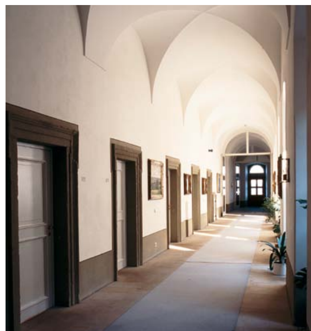
Innenansicht Kloster Banz