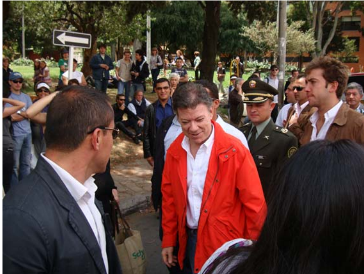
Wahlsieger Juan Manuel Santos

Quelle: Registraduría Nacional del Estado Civil