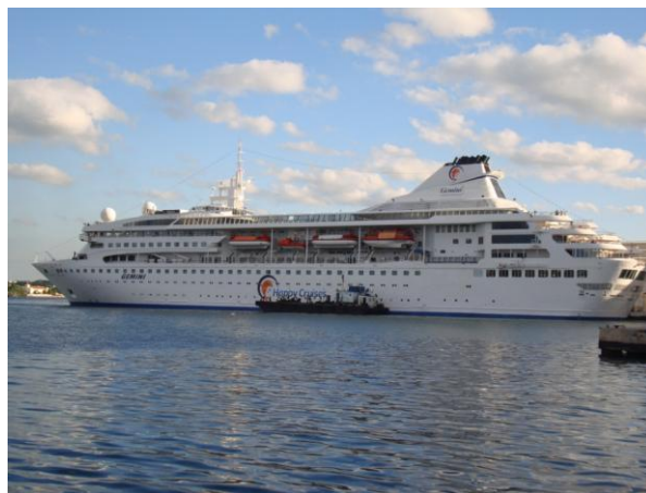
Das 163,8 Meter lange Kreuzfahrtschiff „Gemini“ im Hafen von Havanna

Die Anzahl an Kreuzfahrturlaubern nahm Mitte des vergangenen Jahrzehnts drastisch ab. Damals kaufte das US-amerikanische Unternehmen Royal Caribbean seinen spanischen Konkurrenten Pullmantur und damit dessen Kreuzfahrtschiff „Holiday Dream“, welches regelmäßig nach Kuba gereist war. Wegen der von den USA seit Anfang der 60er-Jahre aufrecht erhaltenen Blockade gegen Kuba steuert das Schiff Kuba nicht mehr an. Aus diesem Grunde ging die jährliche Anzahl an Kreuzfahrttouristen von 100.000 auf 10.000 zurück.