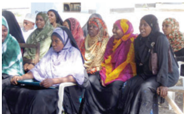
Femmes musulmanes à un séminaire à proximité de l'île de Lamu

Mais à part les projets réalisés avec le concours d'organisations féminines, les femmes sont des groupes ciblés importants dans tous les autres domaines des pays où des projets sont réalisés. Le projet UE en République Démocratique du Congo (un projet de colonies agro-forestières) comporte à part d'autres mesures intégratives, la formation des femmes dans des domaines fondamentaux. Au Kenya la promotion féminine concerne « l'éducation civique ». Dans les sociétés africaines, les positions de multiplicateurs dans la société sont souvent et par tradition occupées par les hommes, mais dans le domaine informel les femmes jouent un rôle important. Même dans les parties musulmanes de la population où le patriarcat est encore plus prononcé, on essaye donc d'atteindre surtout les femmes. Les manifestations de l'année 2007 qui