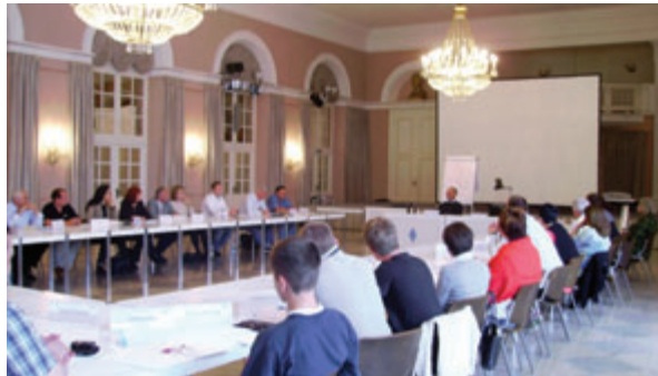
Centre de formation à Wildbad Kreuth