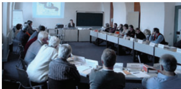
Centre de formation à Kloster Banz