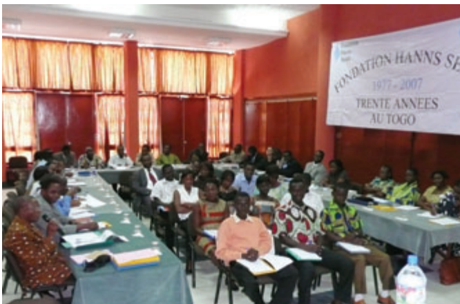
Participants à la conférence de contacts de suivi pour anciens boursiers d'Afrique à Lomé/Togo