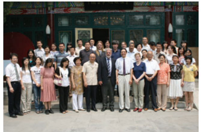
Conférence d'anciens boursiers de République Populaire de Chine de la Fondation Hanns Seidel à Peking

Dans le cadre des mesures d'accompagnement des études qui sont réalisées à l'intention de boursiers étrangers, un certain nombre de séminaires de fin de semaine, hebdomadaires et journaliers ont eu lieu à part les rencontres mensuelles des boursiers de Munich et des environs.