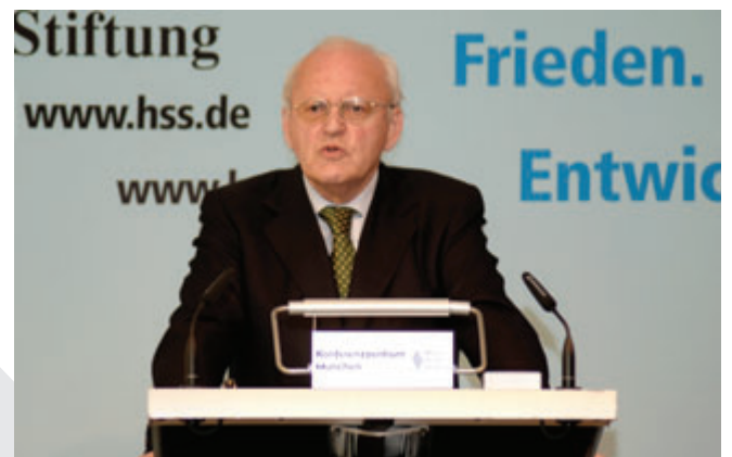
Roman Herzog, ancien Président de la République, était l'invité de la Conférence du 11 mai 2007 sur « L'Europe – vision et réalité »