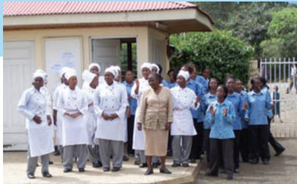
Elèves du Arusha Hotel Training Institute

Dans les pays d'Afrique au sud du Sahara le projet principal de la Fondation Hanns Seidel est de renforcer la position de la femme dans la société. Cette activité est extrêmement variée. Pour la population en général, des séminaires sont offerts sur des thèmes fondamentaux tels que les soins aux nourrissons, l'hygiène, la prévention du SIDA, qui s'adressent à des besoins fondamentaux. Dans le domaine de la promotion économique, les femmes sont invitées à des cours spéciaux sur la comptabilité, le droit fiscal et le planning d'entreprise. En Tanzanie des parlementaires et députées organisées dans l'« Union of Women of Tansania » (UWT), sont des partenaires importantes. Dans le domaine de la promotion féminine, le travail de la Fondation en Tanzanie est exemplaire. Un exemple est l'assistance au Arusha Hotel Training Institute (AHTI) dans