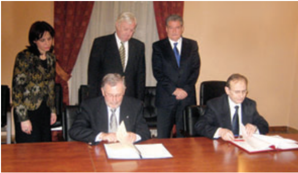
Signature d'un nouvel accord de coopération entre la Fondation Hanns Seidel, représentée par le Directeur des relations internationales, Rainer Gepperth , et le gouvernement d'Albanie en présence du Premier Ministre Sali Berisha

aux frontières extérieures de l'espace Schengen, par exemple, Slovaquie/Ukraine ou Hongrie/Serbie, ainsi qu'à l'intérieur, par exemple à la frontière tchèque-bavaroise ont contribué à réaliser la nouvelle zone Schengen dans les délais, au 21 décembre 2007.