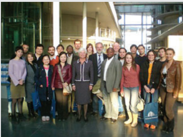
Boursiers étrangers pendant leur visite au Bundestag en compagnie de la Vice-Présidente du Bundestag, Gerda Hasselfeldt, Membre du Parlement

Des conférences de contacts de suivi pour boursiers qui sont rentrés dans leur pays après leur stage ont eu lieu en Roumanie, en Ukraine, Pologne, Thaïlande, en République Populaire de Chine, en Mongolie et en Indonésie.