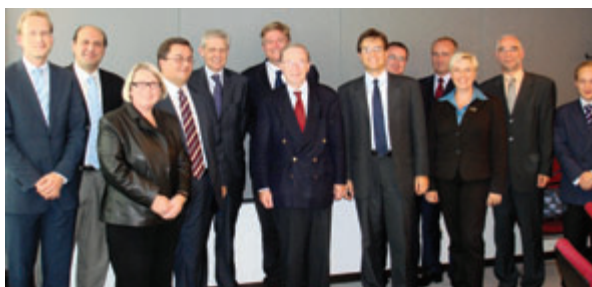
Les représentants des membres fondateurs du « Centre for European Studies » se regroupent, après la signature de l'acte de fondation, autour du Président du Parti Populaire Européen Wilfried Martens

Le 13 septembre 2007, le « Centre for European Studies », le nouveau think tank du Parti Populaire Européen a été fondé à Bruxelles. La Fondation Hanns Seidel est un des huit membres fondateurs de cette nouvelle « usine à penser » dont l'objet est de promouvoir un échange de vues approfondi entre fondations nationales, politiques et scientifiques des milieux chrétiens-démocrates d'Europe.