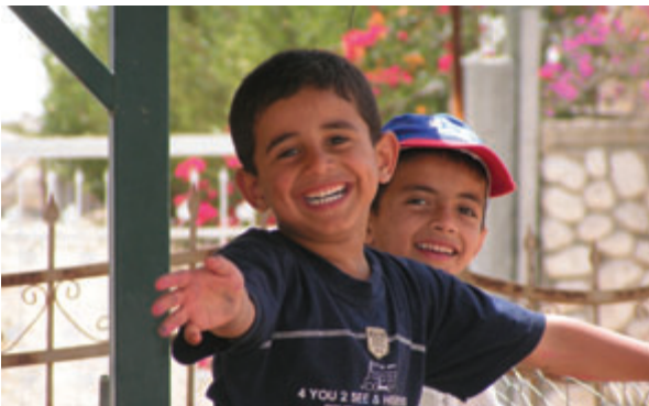
Enfants bédouins dans une maternelle de la ville de Ragat dans le Negeve

La Fondation Hanns Seidel aide depuis longtemps la population bédouine en Israël moyennant plusieurs projets pour offrir une perspective dans la société israélienne aux jeunes femmes bédouines. La formation de mères comme éducatrices dans des maternelles bédouines est un des projets de promo-