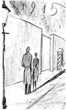
„Vor der Kaserne, vor dem großen Tor ...“ Original-Grafik von Hans Leip, Textdichter von „Lili Marleen“