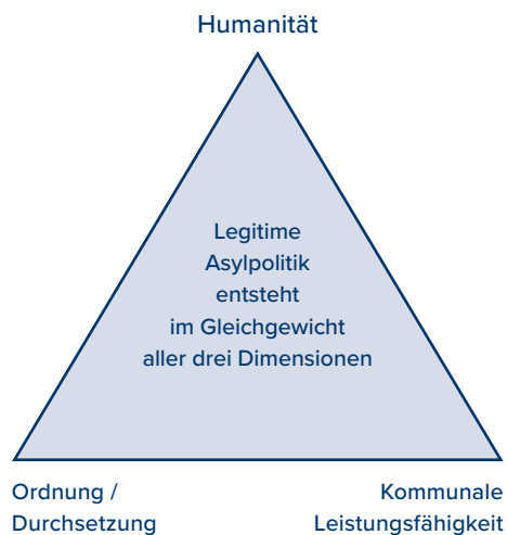
Abbildung 2: Zielkonflikte und Balancepunkte moderner Migrationspolitik

Präventiv ist zudem wichtig, irreführende Erfolgsnarrative der Schleuser zu durchbrechen. In vielen Herkunfts- und Transitregionen operieren Schleuser nicht nur als Transportdienstleister, sondern als kommunikative Marktakteure. Sie verkaufen nicht nur eine Route, sondern ein Zukunftsversprechen. Dieses Geschäftsmodell lässt sich nur schwächen, wenn das Risiko des Scheiterns sichtbar, der Vollzug glaubwürdig und legale Alternativen klar definiert sind (Abbildung 2).