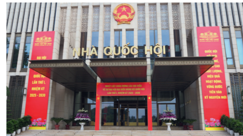
Eingang zur Nationalversammlung Vietnams: Am 16. Juni 2025 verabschiedete das vietnamesische Parlament dort Reformen.