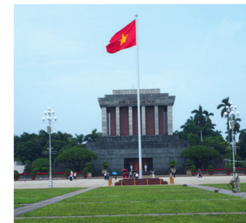
Das Ho-Chi-Minh-Mausoleum in Hanoi bildet das politische Zentrum Vietnams. Es war Schauplatz zahlreicher historischer Ereignisse.