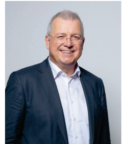
Markus Ferber, MdEP

Demokratie ist in den Kommunen am unmittelbarsten erfahrbar. Kommunalpolitik zeichnet sich durch eine besondere Bürgernähe aus. Die Menschen in den Städten, Gemeinden und Dörfern sind viel näher an den gewählten Politikerinnen und Politikern dran, können Lob und Unmut direkt kundtun und darauf hinweisen, was für ihren Ort, ihre Region wichtig ist und welche Bedürfnisse, Herausforderungen, Probleme – ja auch Ängste sie haben. In den Kommunen kennt man sich, man sieht sich, man tauscht sich zumindest in kleineren Orten auch mal auf dem „kurzen Dienstweg“ aus. „Eine Bürgermeisterwahl ist eine Persönlichkeitswahl mit Inhalten“, sagt Neu-Ulms Oberbürgermeisterin Katrin Albsteiger – und sie hat recht. Aber Politik vor Ort, das ist umgekehrt auch der Bereich, in dem sich Bürgerinnen und Bürger am stärksten selbst beteiligen.