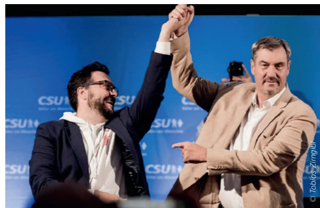
Ministerpräsident Markus Söder (rechts) und Beer beim Dämmerstopp im Juli 2025 in Beratzhausen. Bürgermeister Beer will für eine zweite Amtszeit kandidieren.