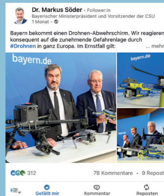
Bayerischer Ministerpräsident und CSU-Vorsitzender Dr. Markus Söder, MdL