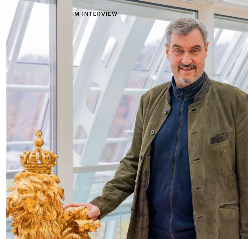
Dr. Markus Söder, Bayerischer Ministerpräsident und CSU-Parteichef, ist viel im Land unterwegs. Er betont, dass der Freistaat und die Kommunen ein starkes Team seien.

Bei der Kommunalwahl stehen vor allem die Kandidaten und Köpfe vor Ort im Vordergrund. Das haben auch die Kommunalwahlen in NRW gezeigt. Dort wurden Amtsinhaber abgewählt, deren Wiederwahl als sicher galt. In anderen Städten waren die Ergebnisse hingegen wie erwartet. Letztlich hängt es von den