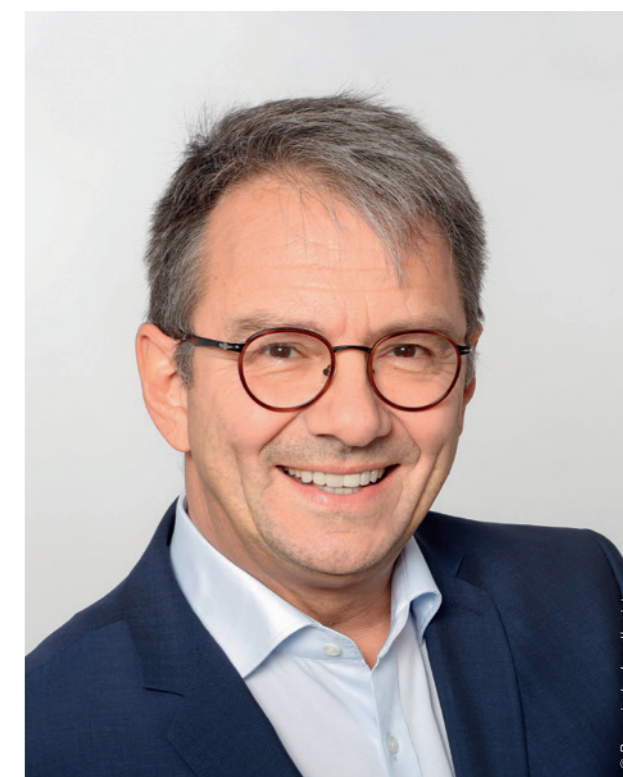
Autor: Thomas Karmasin

Landrat von Fürstfeldbruck und Präsident des Bayerischen Landkreistags