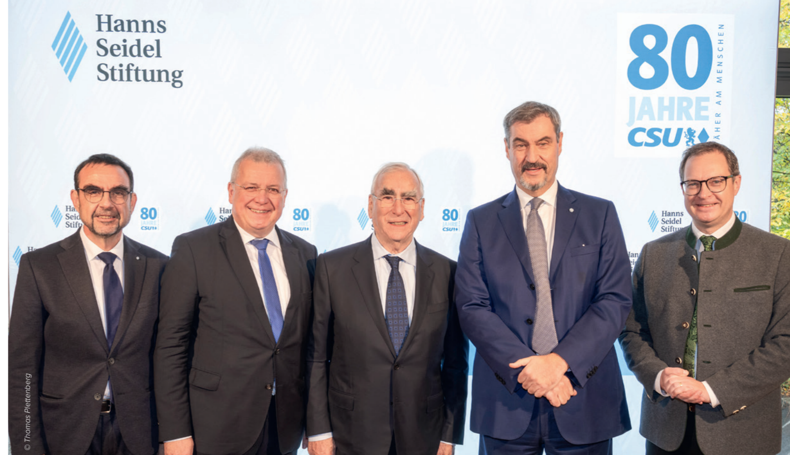
Der Vorsitzende der CSU-Fraktion im Bayerischen Landtag Klaus Holetschek, MdL, mit dem HSS-Vorsitzenden Markus Ferber, MdEP, dem Bundesfinanzminister a. D. Theo Waigel, dem CSU-Vorsitzenden und Bayerischen Ministerpräsidenten Dr. Markus Söder, MdL, und dem CSU-Generalsekretär Martin Huber, MdL (von links nach rechts).