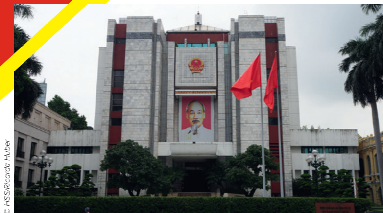
Das Volkskomitee der Provinz Hanoi ist die oberste lokale Verwaltungbehörde, die den Provinzen mehr Kompetenzen ermöglicht.

Die Hanns-Seidel-Stiftung (HSS) erarbeitet gemeinsam mit der Universität für Geistes- und Sozialwissenschaften in Hanoi einen Sammelband, der die laufenden Reformprozesse in Vietnam beleuchtet. Hier werden praktische Erfahrungen aus Bayern und Deutschland bei der Umsetzung von Verwaltungsreformen und Dezentralisierung eingebracht. Neben zahlreichen vietnamesischen Fachleuten beteiligen sich auch Wissenschaftlerinnen und Wissenschaftler der Universitäten Passau, Gießen und Potsdam. Erste Forschungsergebnisse wurden bereits im Juli in Hanoi mit lokalen Entscheidungsträgern diskutiert. Die Veröffentlichung des Bandes ist noch für dieses Jahr in Vietnam vorgesehen.