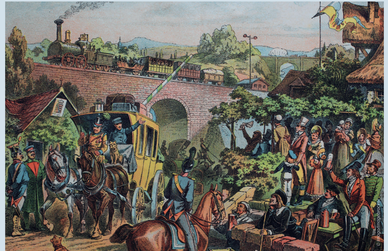
Die erste Eisenbahn, der „Adler“, fuhr von Nürnberg nach Fürth, hier auf einer historischen Lithographie von etwa 1880. Fuhrleute und Kutscher streuten Gerüchte gegen die neue Konkurrenz.

«MEHR ALS ZWEI MONATE DAUERTE DER IN 100 EINZELTEILE ZERLEGTE TRANSPORT DES UNGE- TÜMS NACH NÜRNBERG.»