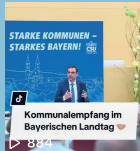
CSU im Landtag