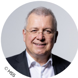
Markus Ferber, MdEP Vorsitzender der Hanns-Seidel-Stiftung