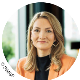
Judith Gerlach, MdL

Bayerische Staatsministerin für Gesundheit, Pflege und Prävention