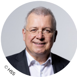
Markus Ferber, MdEP Vorsitzender der Hanns-Seidel-Stiftung

«Der Mensch muss immer im Mittelpunkt stehen.»