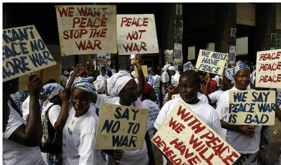
Bild 3: „Frauen in Liberia bereiten sich auf einen Friedensmarsch vor“, Quelle: UN Photo by Eric Kanalstein.

tation mit Gewalt gegen Frauen und Kinder. Im Jahr 2002 schloss sie sich nach Jahren der Flucht und Entbehrung dem West African Network for Peacebuilding an. Gemeinsam mit anderen Frauen kämpfte sie gewaltlos für den Frieden in Liberia und setzt sich bis heute für die Rechte der Frauen ein.