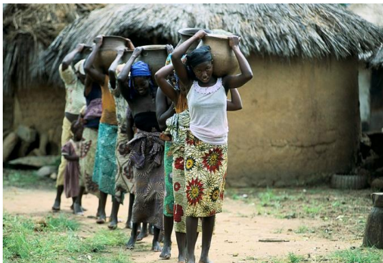
Bild 1: „Junge Frauen in Nigeria tragen Wasser“, Quelle: Weltbank.

gestalten, wurden traditionelles Gewohnheitsrecht und staatliches Recht nach westlichem Vorbild zumeist vermischt. Beim Aufbau dieser Strukturen wurden traditionelle Rechtspraktiken meist durch männliche Stammesführer übermittelt, die ihre Bräuche eigenmächtig und oft zum Nachteil der weiblichen Bevölkerung auslegten. Vielerorts verloren Frauen dadurch Rechte, die ihnen unter den traditionellen Strukturen zugestanden hatten. Insbesondere Heirats-, Scheidungs-, Erb- und Landnutzungsrechte enthalten im postkolonialen Gewohnheitsrecht eine Reihe diskriminierender Elemente und stehen damit häufig im Widerspruch zum staatlichen Recht. Für westafrikanische Frauen bedeutet der „moderne“ Rechtspluralismus somit überwiegend Nachteile.