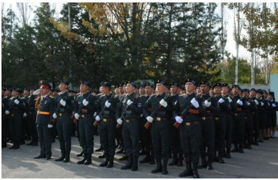
Polizeikadetten in Kirgisistan, Quelle: HSS Kirgisistan.

Als Hauptaufgabe der Reformen sehen sie die Abschaffung des MIA als die rückständigste öffentliche Einrichtung und den Aufbau einer nicht militarisierten, nicht politisierten und nicht korrumpierten Behörde, von der die Sicherheit der Bürger gewährleistet wird. Um diese Reform im derzeitigen politischen System umsetzen zu können, fordern die zivilen Aktivisten, dass während des Reformprozesses als Minister eine Zivilperson, die in der Gesellschaft hohes Vertrauen und Ansehen genießt, eingesetzt wird.