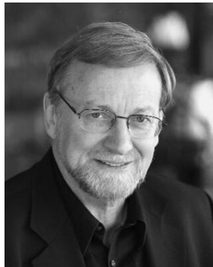
Gareth J. Evans: Australiens ehemaliger Außenminister in neuer Mission.

Die ICG wurde im Schlusskommuniqué der Tagung der EU-Außenminister in Kopenhagen erwähnt, wo die Nahostpolitik Europas vis-a-vis Washing-