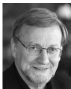
Evans, J. Gareth Präsident der International Crisis Group (ICG), Brüssel