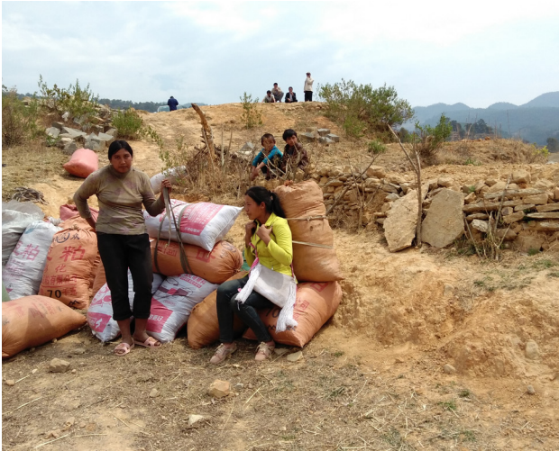
In der strukturschwachen Provinz Jiangxi sind die Böden karg, was landwirtschaftliches Arbeiten und Einkommen erschwert.

So lange der ländliche Raum, insbesondere seine armen Regionen hinter dem Rest des Landes liegen, so lange können wir nicht sagen, dass wir eine Gesellschaft mit angemessenem Wohlstand erreicht haben.