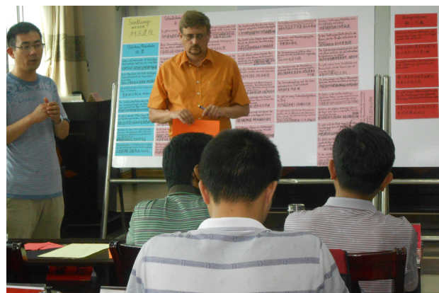
Diskussionen mit Behördenvertretern zur Akzeptanz und Absicherung der Planung

Raum zu halten, ob in den neuen Zentren oder in den Landgemeinden und Dörfern. Die Verbesserung der ländlichen Lebens- und Arbeitsqualität zur harmonischen Entwicklung