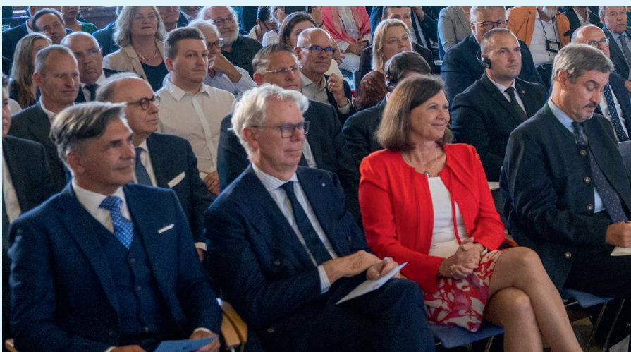
Die moldauische Präsidentin Maia Sandu sprach vor voll besetztem Kaisersaal in der Residenz.