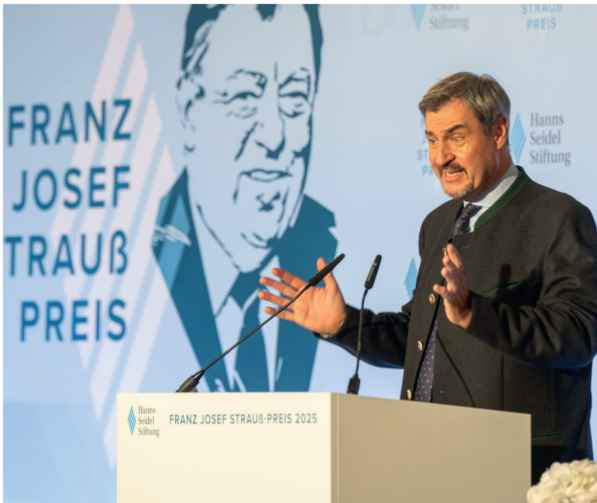
Der Bayerische Ministerpräsident Dr. Markus Söder, MdL, hob den Mut und das Durchhaltevermögen von Maia Sandu hervor.