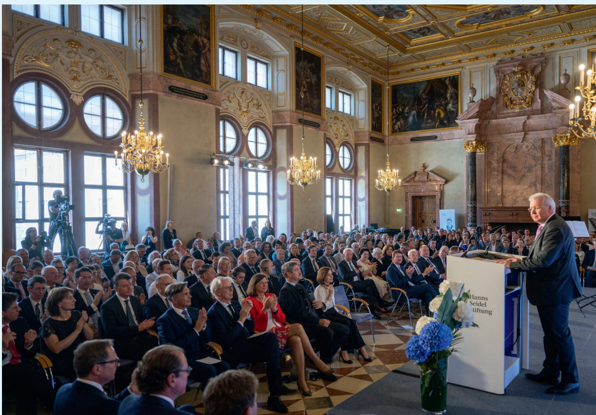
HSS-Vorsitzender Markus Ferber, MdEP, lobte Maia Sandus Engagement für die Demokratie.