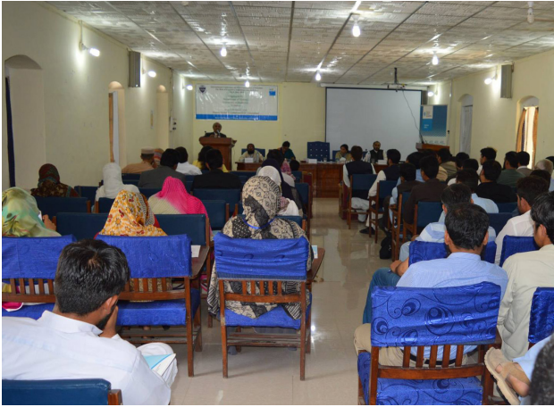
Akademische Konferenz zur pakistaniischen Verfassung