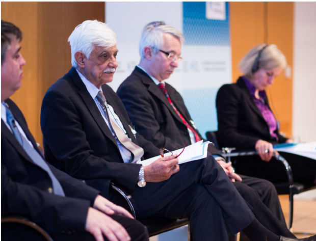
Senator Taj Haider bei den Münchner Föderalismustagen 2016

den. Daneben wird über Trainings zu Forschungsmethodiken an kleineren Universitäten Pakistans das Handwerk zu quantitativer wie qualitativer Forschung in den Sozialwissenschaften vermittelt. Ein mehrjähriges Forschungsprogramm zum Thema „Nation-Building in Pakistan“ komplettiert den Ansatz zur Ausbildung des akademischen Nachwuchses.