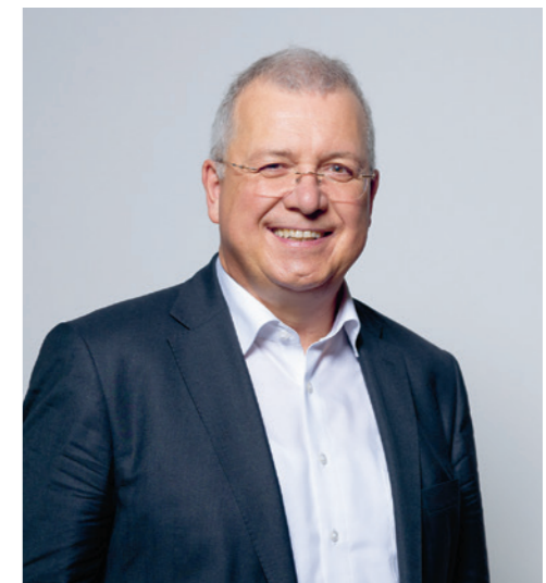
Markus Ferber, MdEP