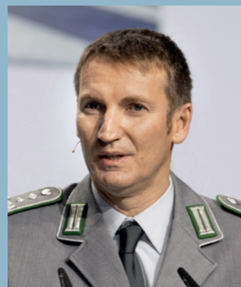
Professor Dr. Patrick Sensburg Präsident des Reservistenverbandes (Verband der Reservisten der Deutschen Bundeswehr e.V.)

Der russische Angriffskrieg auf die Ukraine und die Personalsorgen der Bundeswehr haben in Deutschland zu einem Umdenken in Fragen der militärischen Sicherheit geführt. Während einige Befürworter sogar die 2011 ausgesetzte Wehrpflicht wieder beleben wollen, wird aufgrund der heute fehlenden Ausbildungsstrukturen in der Bundeswehr doch meistens nur über Sinn und Unsinn einer allgemeinen Dienstpflicht in verschiedenen Tätigkeitsbereichen diskutiert.