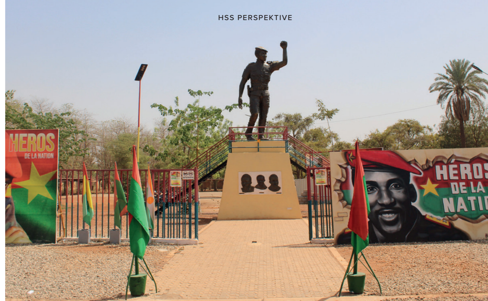
Denkmal des Nationalhelden Thomas Sankara in Ouagadougou, der von 1983 bis 1987 erster Präsident Burkina Fasos war und 1987 ermordet wurde.

Auch für die Verschlechterung der Sicherheitslage wird Frankreich verantwortlich gemacht, da die militärische Zusammenarbeit nicht zu einer Zerschlagung des Terrorismus geführt hat. In der öffentlichen Meinung wird eine antifranzösische Stimmung erzeugt, welche durch mediale Hetze in sozialen Netzwerken befeuert wird. Es sei alles die Schuld Frankreichs. Dies wird in der Bevölkerung kaum hinterfragt.