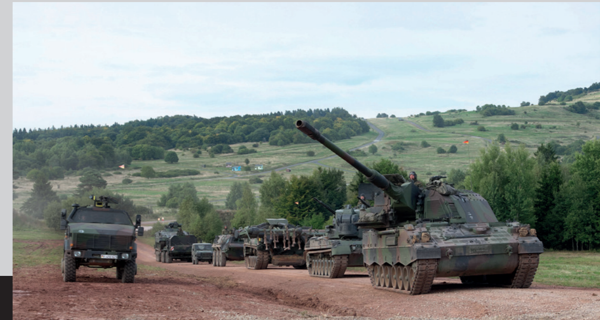
In Wildflecken wird auch mit schwerem Gerät trainiert. Einiges davon wurde ausgemustert und an die Ukraine geliefert. (v.l.): Allschutz-Transport-Fahrzeug Dingo, Schwertransporter Elefant, Allradfahrzeug Wolf, Transportpanzer Fuchs, Minenräumpanzer Keiler, Flugabwehrkanonenpanzer Gepard und Panzerhaubitze 2000.

Veitshöchheim, Gegenwart. Das Sondervermögen ist bereits voll verplant, das Zwei-Prozent-Ziel nur durch Tuschenspielertricks erreicht, der Kanzler zögert bei jeder Waffenlieferung. Etwas hat sich aber geändert: Die 10. Panzerdivision wird der NATO bis 2025 einsatzfähig zur Verfügung gestellt – zwei Jahre früher als vorgesehen.