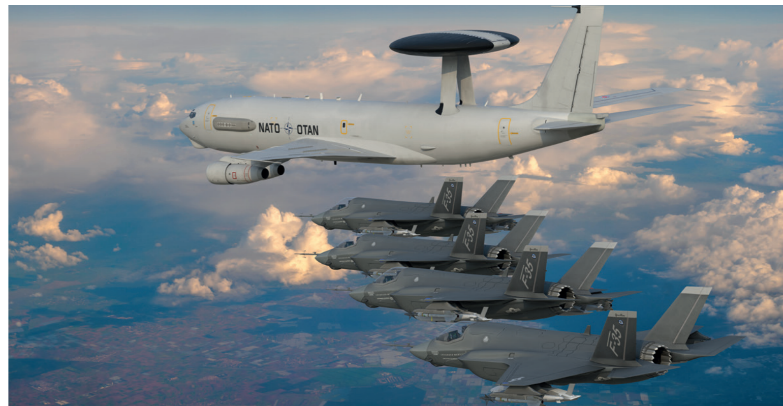
Die NATO gewinnt gerade in kriegerischen Zeiten an Bedeutung.

Ebenso wichtig wie ein effektiver gesamtstaatlicher Ansatz, der Sicherheit in all seinen Facetten behandelt, ist die Kommunikation und Vermittlung von Risiken und Maßnahmen gegenüber der Bevölkerung – nicht nur zur Akzeptanz politischer Entscheidungen in demokratisch verfassten Systemen, sondern auch zur Steigerung der gesellschaftlichen Resilienz gegenüber dem hybriden Bedrohungsspektrum.