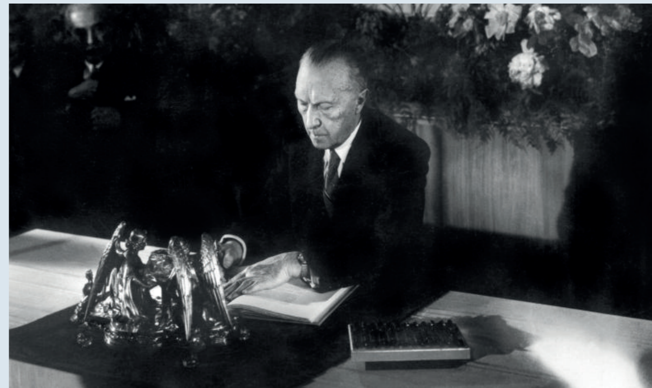
Am 23. Mai 1949 unterzeichnet Adenauer das Grundgesetz.

Am 18., 20. und 21. Mai 1949 billigten zehn von elf Landtagen das Grundgesetz. Bayern allerdings lehnte die Ratifizierung mit 101 gegen 63 Stimmen ab. Die neue Verfassung, so befürchtete die Bayerische Staatsregierung, würde den staatlichen Charakter der einzelnen Länder, unter anderem durch Befugnisse des Bundes bezüglich der Steuerverwaltung, Justizhoheit und Finanzen, zu sehr schmälern. Ministerpräsident Hans Ehard formulierte die Haltung Bayerns mit dem Ausspruch: „Nein zum