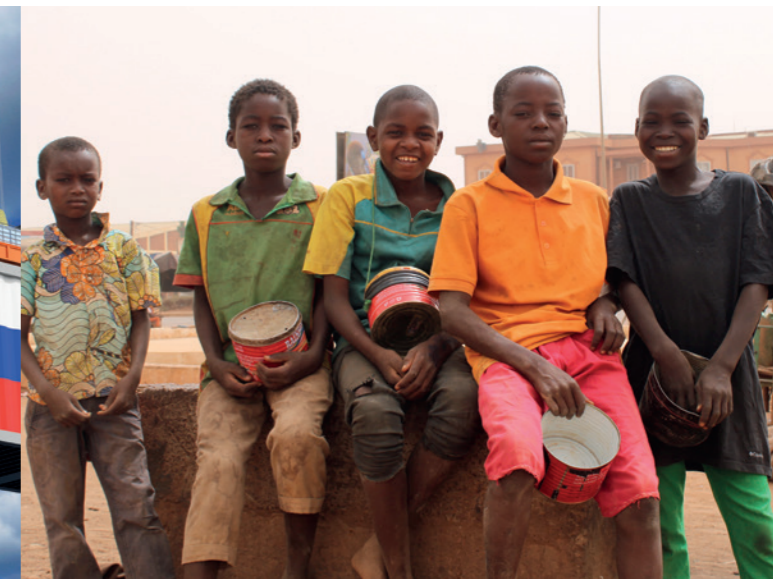
Flüchtlingkinder am Straßenrand in Ouagadougou