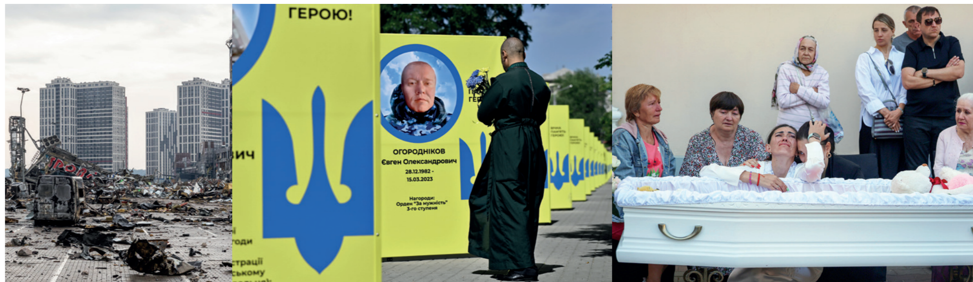
Opfer des Krieges: ein durch russische Raketen zerstörtes Einkaufszentrum in Kyjiw, die Allee der gefallenen ukrainischen Helden in Saporischschja und eine weinende Mutter am Sarg ihres getöteten vierjährigen Mädchens in Odessa.

Die russischen Führungseliten sehen sich seit mehr als einem Jahrzehnt in einem Krieg mit dem Westen. Der Krieg in der Ukraine ist aus Sicht des Kremls ein Stellvertreterkrieg vor allem mit den USA und der NATO, wobei die Ukraine ein Schlüsselstaat für die imperialen Ambitionen russischer Eliten ist. Der Krieg wird das Ende des russischen Imperiums beschleunigen, Russland wird wirtschaftlich, technologisch und militärisch geschwächt aus diesem Krieg hervorgehen. Jedoch hängt es auch von Europa und den USA ab, welche Rolle Russland zukünftig in Europa spielen wird: Wenn es den Krieg gewinnt, kann es die europäische Sicherheitsordnung mit Einfluss- und Grauzonen und einer neuen Blocklogik maßgeblich mitgestalten. Gleichzeitig ist Russland zu schwach, um global eine gestaltende Macht zu sein, und es wird deshalb weiter disruptiv und aggressiv auftreten.