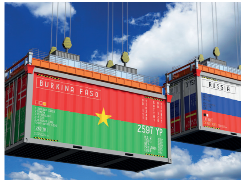
Russland gewinnt in den Ländern Westafrikas an Popularität und wirtschaftlichem Einfluss.