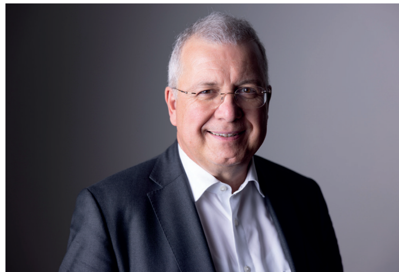
Markus Ferber ist Vorsitzender der Hanns-Seidel-Stiftung und langjähriges Mitglied des Europäischen Parlaments. Er setzt sich für die Stärkung der Gemeinsamen Sicherheits- und Verteidigungspolitik ein.

Dies kann kein europäischer Staat allein leisten und die dafür notwendige Stärkung der Gemeinsamen Sicherheits- und Verteidigungspolitik (GSVP) ist eine schwierige Aufgabe, die der gestiegenen Komplexität der geopolitischen Lage gerecht werden muss.