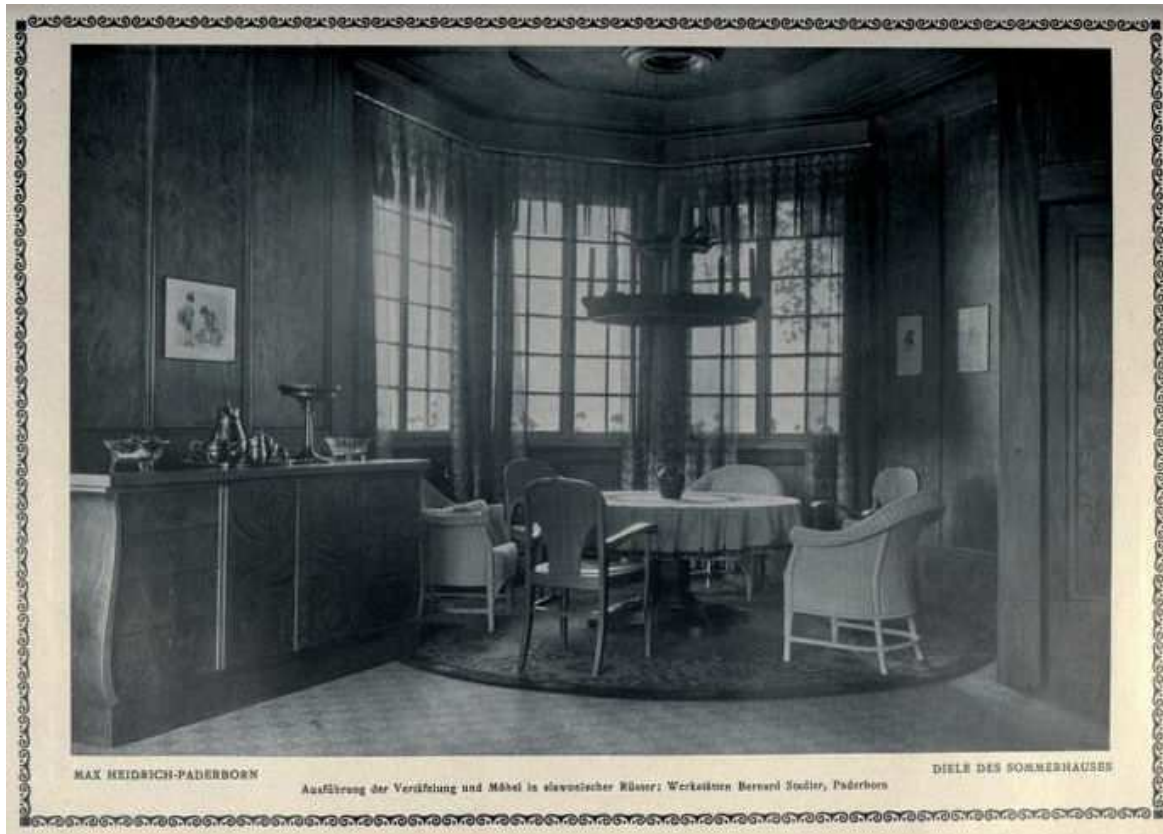
Abbildung 5: Max Heidrich-Paderborn, Diele des Sommerhauses, 1914