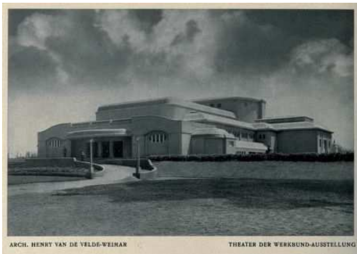
Abbildung 2: Henry van de Velde, Werkbund-Theater, 1914