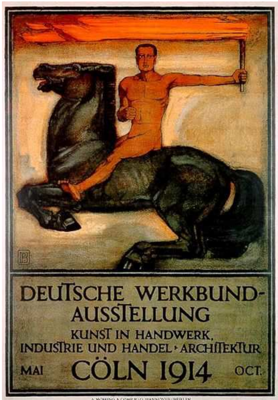
Abbildung 1: Peter Behrens, Werkbund-Ausstellungsplakat, 1914