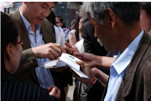
Verteilung der Verfassung und der VwGO der Mongolei an Bürger auf dem Freiheitsplatz

Die Mongolei befindet sich seit 1990 auf dem Weg zur Demokratie und Rechtsstaat. Noch heute sind jedoch die Rechtsentwicklung und die Erhöhung des Rechtsbewusst-