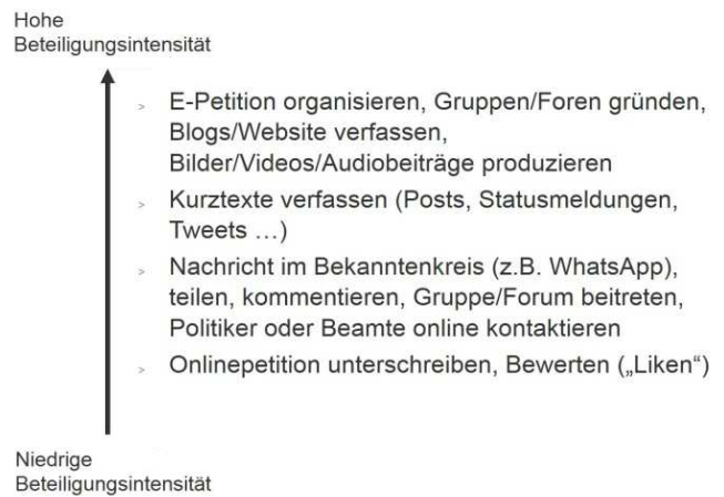
Abbildung 3: Möglichkeiten der Onlinebeteiligung nach Aufwand

Quelle: eigene Darstellung zu eigenen Auswertungen der Studie von Renner, Regina: Politische Beteiligung junger Menschen in Bayern. Begleitbefragung des Bayerischen Jugendrings zum Modellprojekt Onlinepartizipation, München 2017