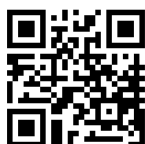
Mehr Factsheets finden Sie hier.

@ info@hss.or.kr www.hss.de/korea https://www.facebook.com/HannsSeidelFoundationKorea