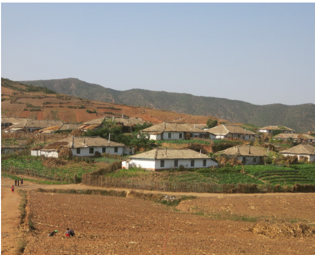
Bild eines nordkoreanischen Dorfes - Abholzung für den Gewinn von Anbauflächen an Hängen führen zu Erosion und verringern den Schutz vor Überflutungen.