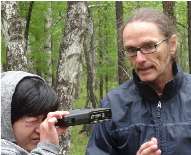
Durch den Einsatz moderner Technik hat sich die Vorgehensweise bei der Durchführung von Forstinventuren in den letzten Jahren verändert.