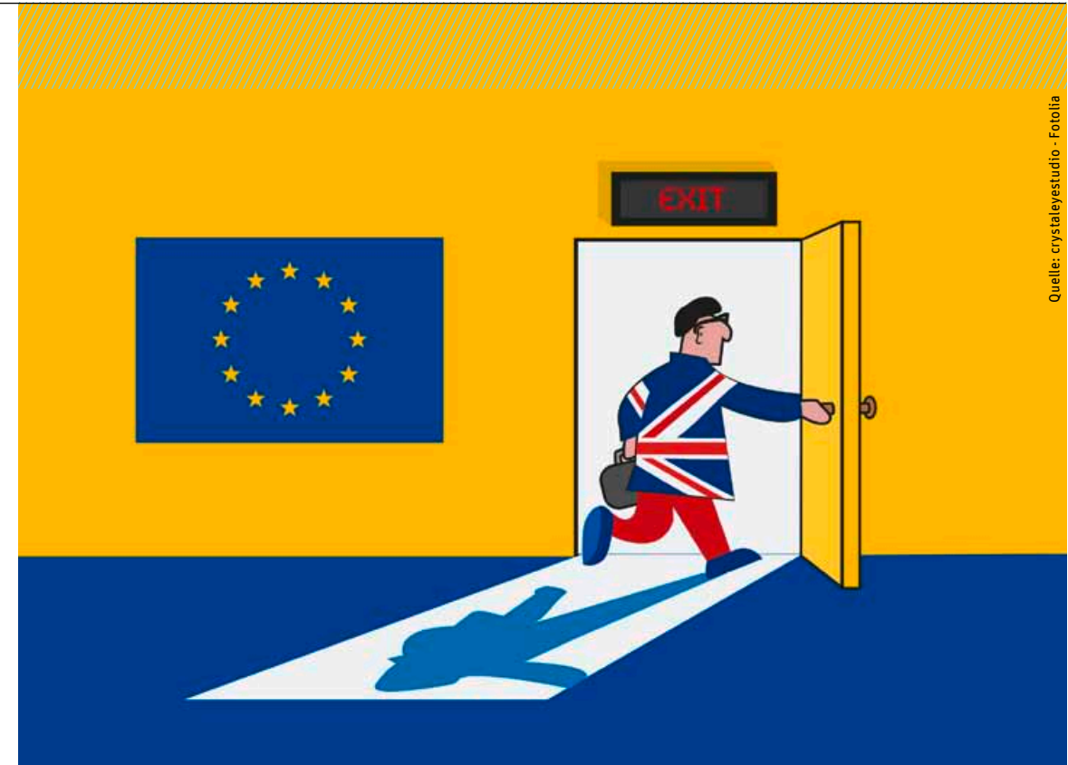
Großbritannien hat die EU verlassen und dabei bleibt es auch nach Aussage der neuen Premierministerin Theresa May.

Das zentrale Argument, dass England die Hoheit über die Wanderbewegungen arbeitswilliger Europäer wieder erlangen wolle, ist noch während der Auszählung der letzten Wahlkreise in sich zusammengebrochen. Wenn Großbritannien weiterhin in irgendeiner Form mit dem Europäischen Markt in Kontakt bleiben will, muss es dessen Regeln akzeptieren. Die Personenfreizügigkeit gehört eindeutig dazu! Norwegen, das gerne als Modell erhalten durfte, musste diese Freizügigkeit akzeptieren. Und zahlt darüber hinaus eine Art Eintrittsgeld, um sich an den Binnenmarkt andocken zu dürfen – ohne auch nur eine minimale Entscheidungskompetenz darüber zu haben, was mit den Geldern passiert. Das ist nun die nächste Zukunft Großbritanniens.