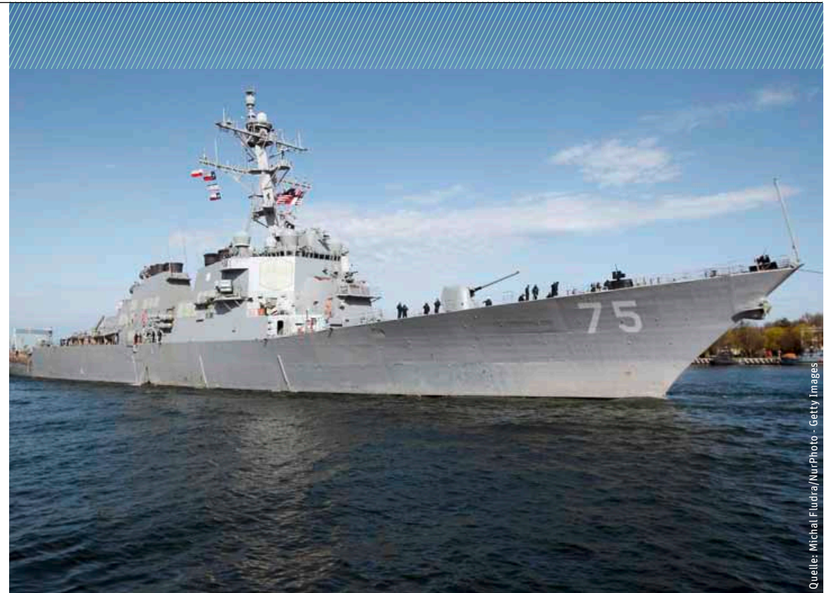
Rückkehr zum Kalten Krieg? Bis auf 9 Meter kamen russische Militärflugzeuge im April 2016 dem amerikanischen Marineschiff „USS Donald Cook“ in internationalen Gewässern nahe.

Stoltenberg, dass Abschreckung und Schutz vor Russland in diesen Tagen so maßgeblich geworden sind wie der Dialog. 2 In der Konsequenz heißt das: Wir müssen als NATO so stark bleiben, damit wir unsere militärischen Fähigkei-