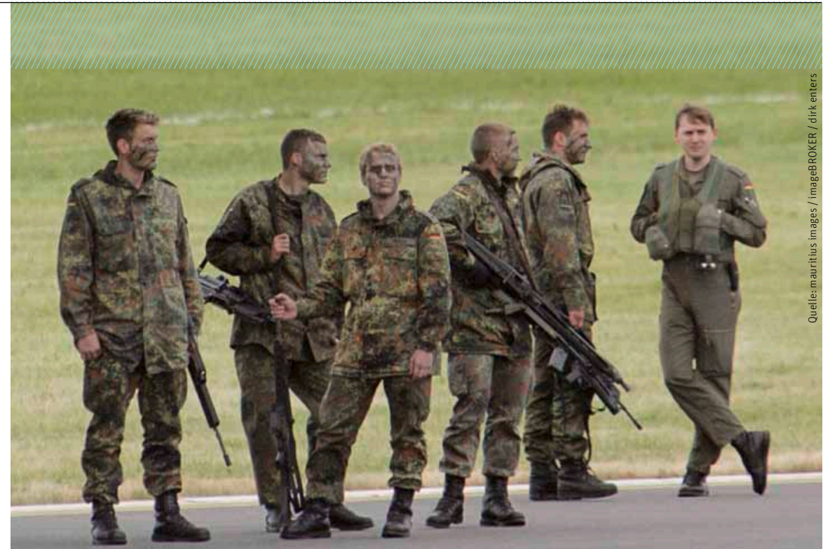
Die Bundeswehr entwickelt sich von einer reinen Verteidigungsarmee zur Eingriffstruppe. Die allgemeine Weltlage macht dies unumgänglich.

ren Mitteln ein wichtiges Spannungsfeld dar, dessen Lösung zwar erfolgreich, in der Praxis jedoch immer prekär war. Dieses Spannungsfeld ist, zumindest derzeit, aufgrund der strategischen Lage nicht auf der Tagesordnung, ohne dass damit eine Garantie für die Zukunft abgeben werden kann. Nicht völlig ausschließen kann man terroristische Anschläge mit nuklearem Material, ein Bedrohungsszenario, gegen das die Bundeswehr jedoch nur eine sehr beschränkte Antwort bereithalten kann. Diese Form der „nuklearen Bedrohung“ ist ein Element „hybrider Bedrohungsformen“, wie sie im Diskussionsprozess zur Vorbereitung des in diesem Jahr erscheinenden Weißbuches diskutiert wurden. 2 Sie steht stellvertretend für die Notwendigkeit eines umfassenden Sicherheitskonzepts, das andere Sicher-