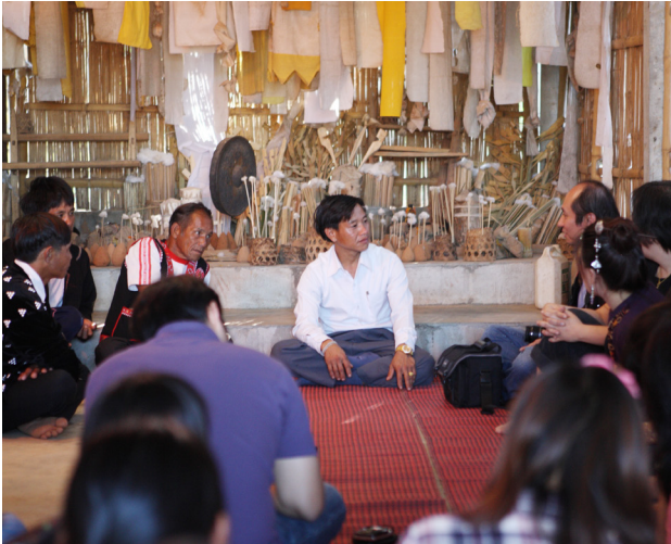
Hilfesuchende Staatenlose erhalten Unterstützung