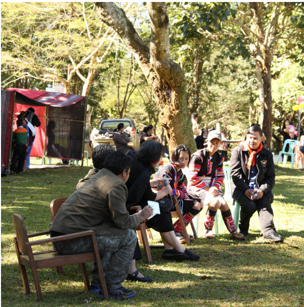
Rechtsberatung durch die Juristische Fakultät der Thammasat-Universität Bangkok