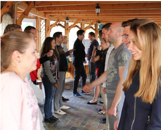
Projekt „Jugend verbindet die Ukraine“: Jugendliche aus der Ost- und Westukraine überwinden im Dialog Stereotype.