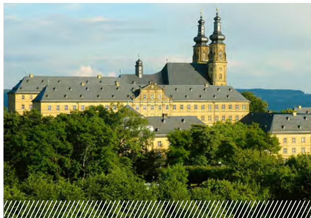
Образовательный центр «Монастырь Банц»