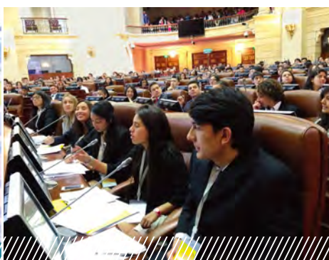
Взгляд на работу парламента в Колумбии