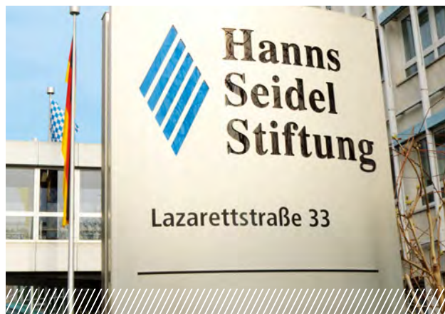
Центральный офис фонда, Мюнхен