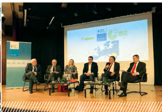
Германско-греческий симпозиум в Афинах о безопасности и стабильности на Балканах