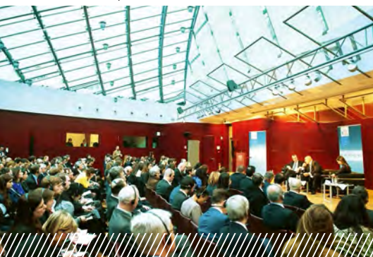
Подиумная дискуссия в Брюсселе о роли Балкан