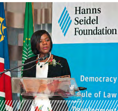
Уполномоченная по правам человека Южной Африки Thulisile Madonsela