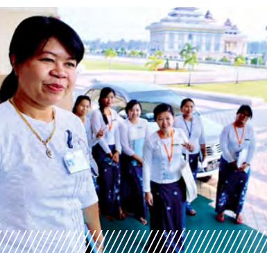
Местный парламент в Мьянме – Создание службы для посетителей