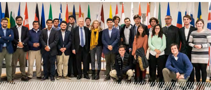
Делегация из Чили на тему «Институты ЕС и текущие события в ЕС» в Брюсселе