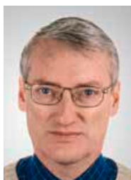
/// DR. MARTIN PABST

‚Arabisch‘ zum Synonym für Uneinigkeit, Dysfunktionalität und Selbstzerstörung geworden ist. Obwohl immer wieder ehrgeizige ‚arabische‘ Pläne für neue Koalitionen verkündet werden, besteht die Realität aus gescheiterter innerer Führung und Entwicklung, sinnlosen Streitigkeiten zwischen arabischen Staaten sowie der Unfähigkeit zu kooperieren und zu koordinieren, und dies zu einem Zeitpunkt, an dem gemeinsames Handeln bitter notwendig wäre.“ 9 ///