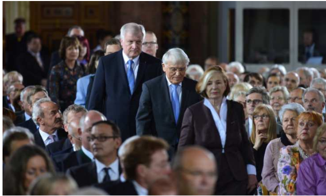
Einzug in den Kaisersaal der Residenz