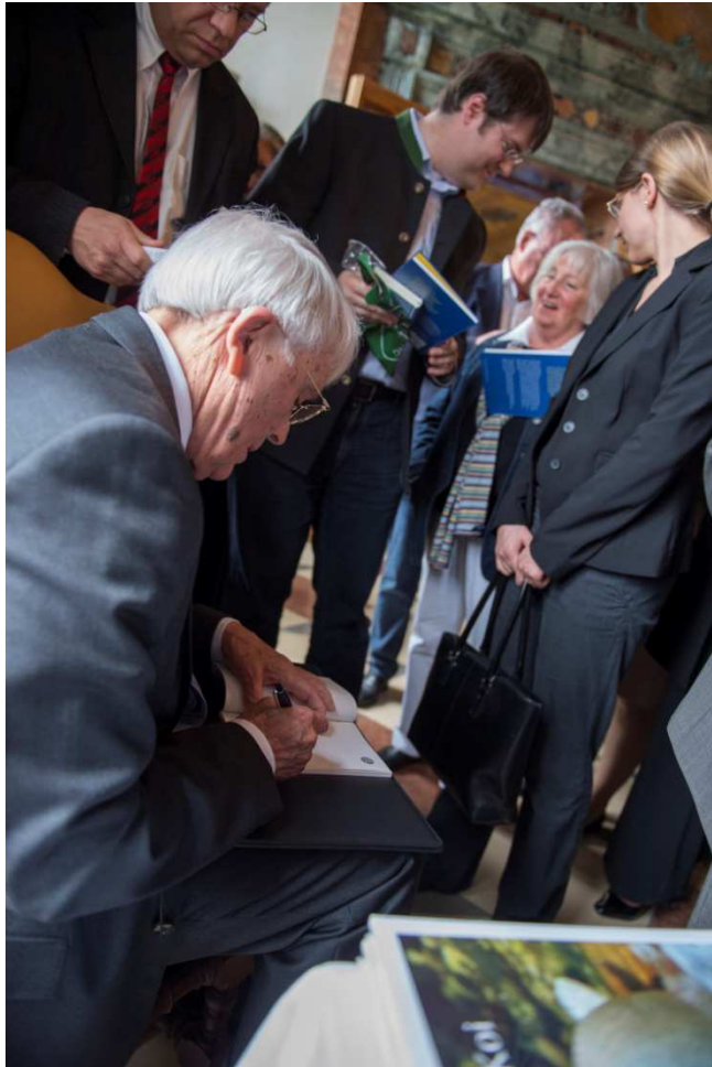
Reiner Kunze beim Signieren seiner Gedichtbände