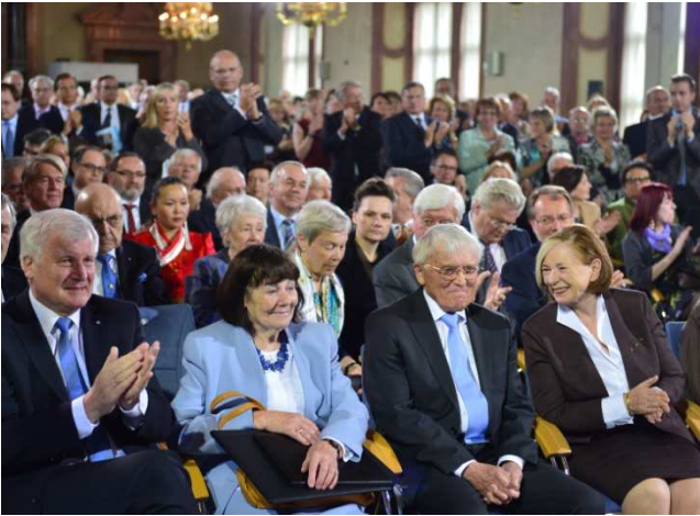
Reiner Kunze nimmt seinen Applaus sichtbar gerührt entgegen