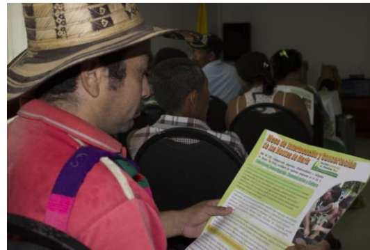
Informationsveranstaltung der HSS in Montes de María.

des Friedensausschusses des kolumbianischen Kongresses – mit dem die HSS ebenfalls punktuell zusammenarbeitet – kürzlich mit Vertretern der vertriebenen Landbevölkerung aus der Region Montes de María zusammengetroffen. Von großer Bedeutung war in diesem Zusammenhang auch die Teilnahme sehr hochrangiger Militärvertreter, namentlich des kommandierenden Admirals der kolumbianischen Marineflotte für den Karibikraum sowie des Kommandeurs der für die Region zuständigen Brigade der Marine-Infanterie. Denn mehr noch als die Polizei ist es noch immer das Militär, das die Sicherheit der Menschen in der Region bestmöglich garantiert und auch als verlängerter Arm des Zentralstaats im politisch-administrativen Raum ein positiver und gesellschaftlich zunehmend anerkannter und gefragter Ordnungsfaktor ist.