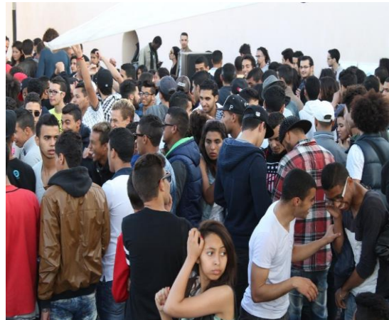
Jugendliche feiern an einem Samstagnachmittag ausgelassen eine Housemusik- und Breakdanceparty auf einem Vorplatz der Stadtmauer zwischen Boulevard Sour Jdid und der Medina, während in unmittelbarer Nachbarschaft Muslime zum Nachmittagsgebet in die Moschee eilen. Die Gegensätze könnten nicht größer sein, doch ist das ein wesentliches Faszinosum der vier Millionen Metropole.

In Casablanca manifestieren sich dagegen die Widersprüche und Disparitäten der marokkanischen Gesellschaft wie in keiner anderen Stadt des Landes. Nirgendwo im Land gibt es mehr Modernität und findet man so viel Toleranz gegenüber dem Glücksspiel, dem Alkohol und sogar der offiziell streng verbotenen Prostitution. Doch nirgendwo findet man zugleich so viel gebündelte Armut im Land wie in den Bidonvilles Sidi Moumen und Sidi Bernoussi sowie in dem gigantischen Vorort Mediouna. Die Kriminalitätsrate ist im Landesvergleich exorbitant hoch. Der Verkehr bricht regel-