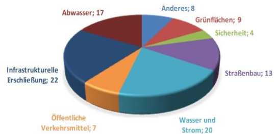
INVESTITIONSSSEKTOREN NOTFALLPLAN CASABLANCA 2014 IN PROZENT

L'ÉCONOMISTE (2014) : Wessal Cassablanca Port, Un Mega-Projet de 6 Milliards de DH. Ausgabe 4246, URL http://www.leconomiste.com/article/930281-wessal-casablanca-portun-m-ga-projet-de-6-milliards-de-dh [20.05.2014].