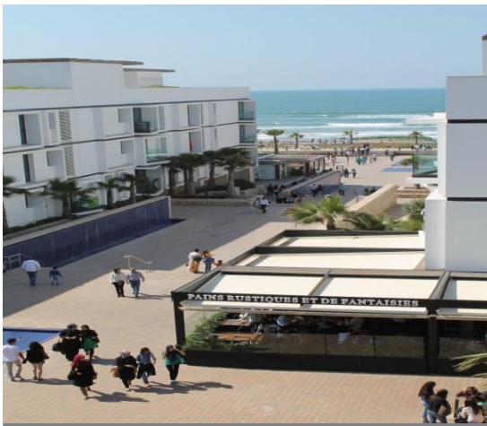
Im eleganten Livingresort Anfaplace herrscht tagtäglich bis 22.30 Uhr ein buntes Treiben. Die Anlage ist umgeben von exklusiven Luxusapartments, die preislich mühelos mit großzügigen Wohnungen in München oder London mithalten können.

Die großen sozialen Disparitäten bleiben dagegen nicht nur für Marokkos König und seine Berater, den Makhzen , sondern auch für die Verantwortlichen der Region Le Grand Casablanca die politische Herausforderung schlechthin. Schon einmal gelang es einer verschwindend kleinen Gruppe, der sogenannten Salafia Jihadia , sozial extrem benachteiligte Jugendliche für den Einsatz blinder und nihilistischer Gewalt gegen soziales Unrecht und Korruption zu sensibilisieren. Das Resultat war ein verheerendes Inferno, das die Stadt am 16. Mai 2003 heimsuchte und schwer traumatisiert hat.